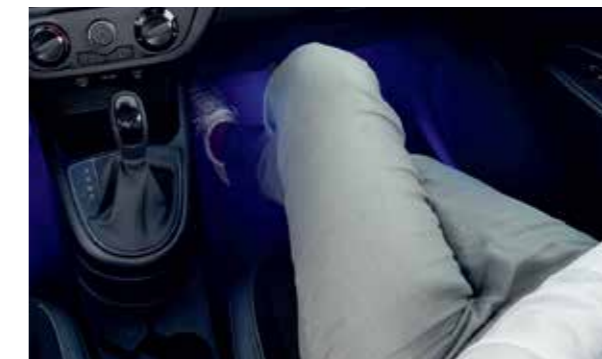
Đèn nội thất