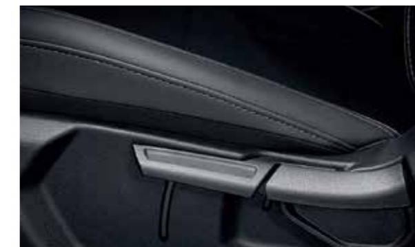
Ghế lái điều chỉnh 6 hướng