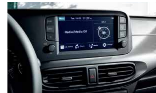
Màn hình giải trí 8 inch