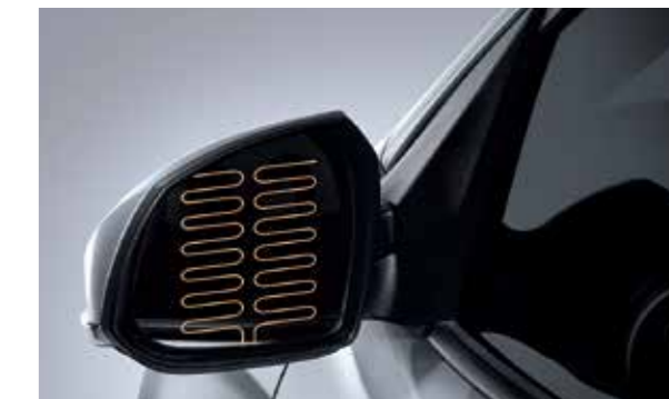
Gương chiếu hậu chỉnh điện gập điện, sấy điện