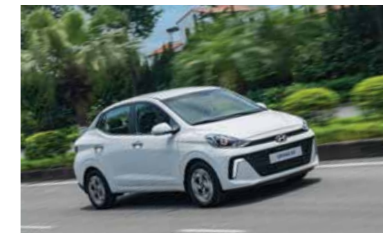
Hệ thống hỗ trợ khởi hành ngang dốc HAC