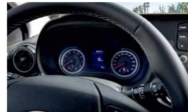
Màn hình thông tin 3.5 inch

Nội thất hiện đại, hoàn thiện kết hợp với không gian rộng rãi làm cho những chuyến đi dài trở thành một trải nghiệm thú vị.