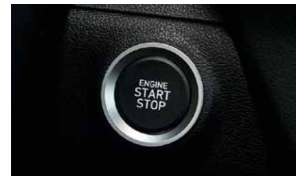
Khởi động bằng nút bấm