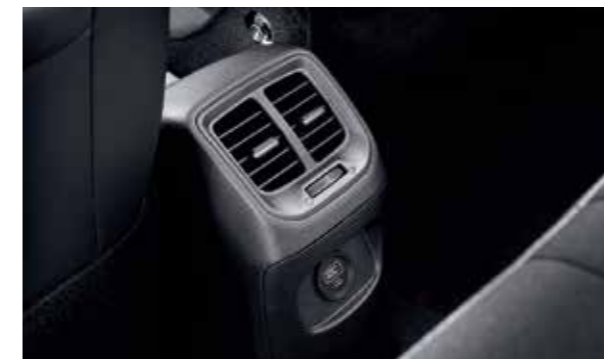
Cửa gió điều hòa hàng ghế thứ 2