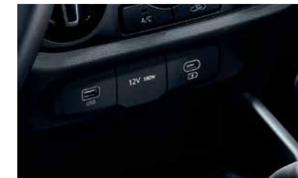
Cổng sạc Type C