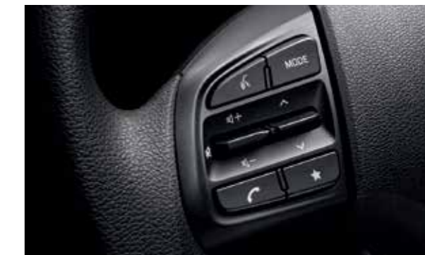
Cụm điều chỉnh media tích hợp nhận diện giọng nói